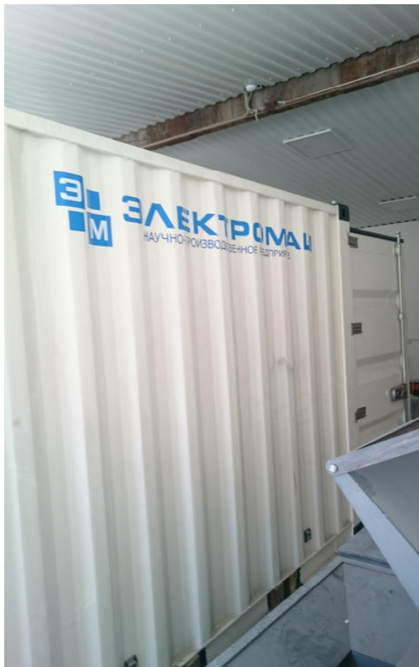
Вид сбоку корпуса- контейнера