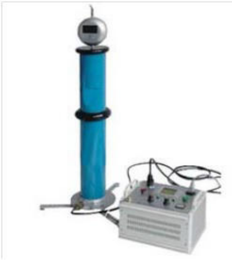
Высоковольтный блок испытания выпрямленным напряжением со встроенным контролем тока утечки, расчетом коэффициента нелинейности, защитой от перегрева обмоток. ИПТ-80