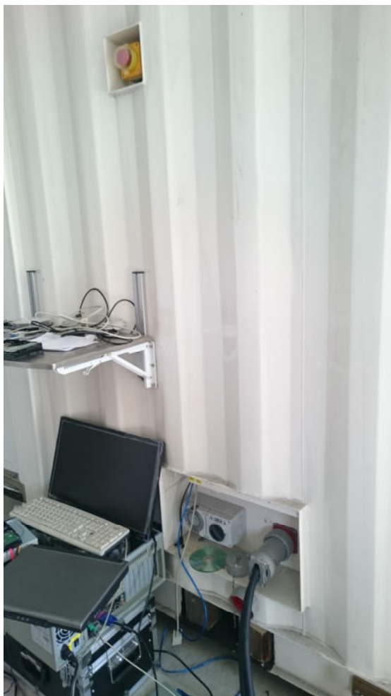
Разъемы для подключения питания, ноутбука для автоматического управления