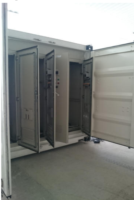
Низковольтный отсек со шкафами питания, управления с контроллером MITSUBISHI