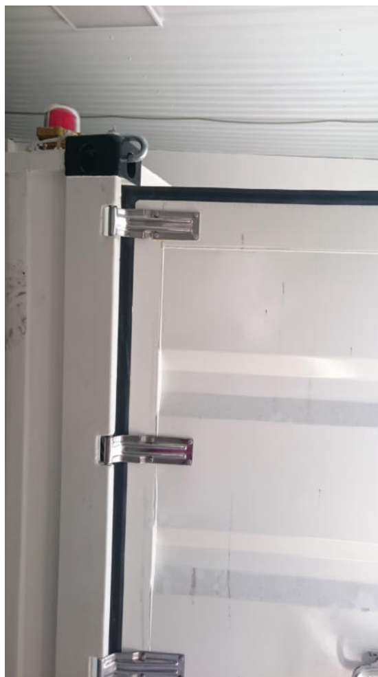
Сигнальная лампа при проведении высоковольтных испытаний