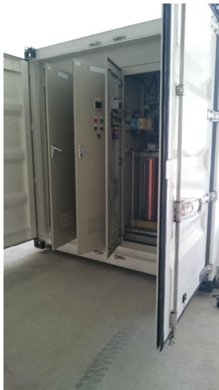
Шкаф регулятора напряжения автотрансформаторного с защитами от КЗ и перенапряжений АВВ