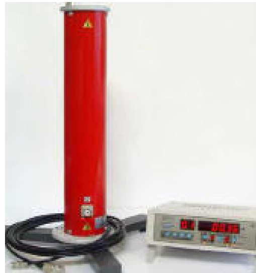
Измерительная система ИС-50э