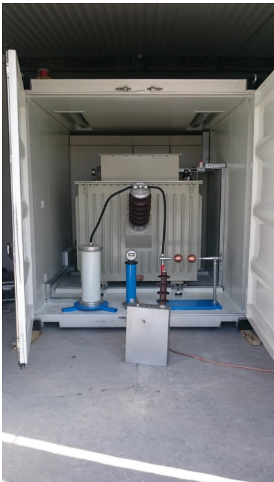
Высоковольтный отсек с резонансным реактором, делителем напряжения, шаровым разрядником и блоком выпрямленного напряжения