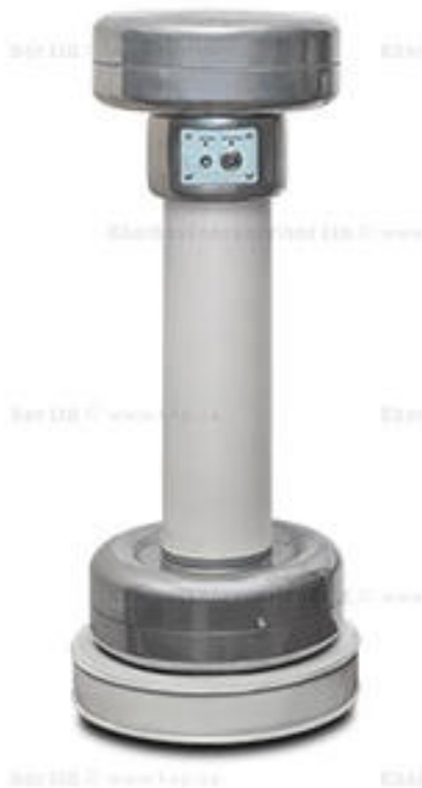
Измеритель электрической емкости и тангенса угла диэлектрических потерь (опция)